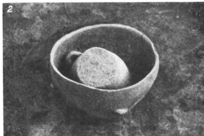
Fig. 1. Satu-Nou. Morminte de incinerare în situ: 1, mormintul 23; 2, mormintul 21.